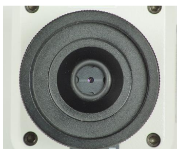
Fig. 1: Anteparo colocado na lente de focalização e fixada com o anel O.

A Moticom pode, se for o caso reajustada horizontalmente com os parafusos de fixação um pouco afrouxados em alguns milímetros.