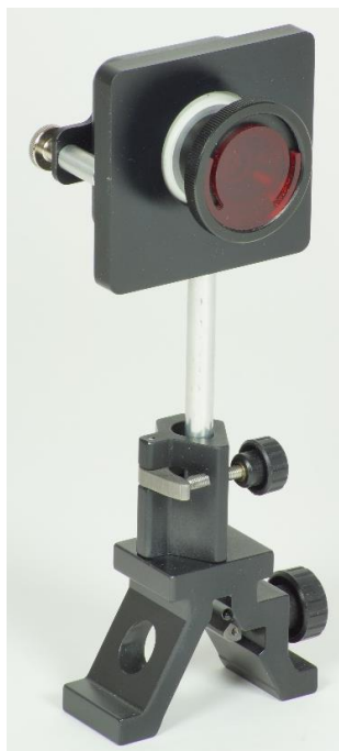
Fig. 2: Módulo de câmera montado pronto.