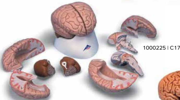
1000225 | C17