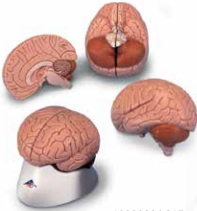
1000222 | C15