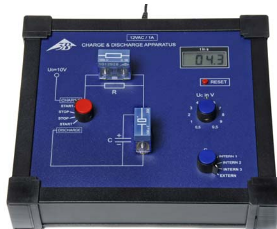
Fig. 1 Medição de par externo de Resistência / Capacitor