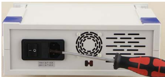
Fig. 1 Troca de fusíveis