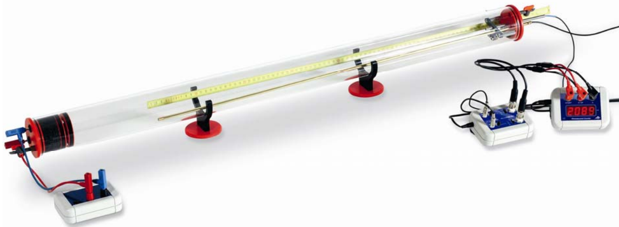
Fig. 1 Montagem do experimento com tubo de Kundt