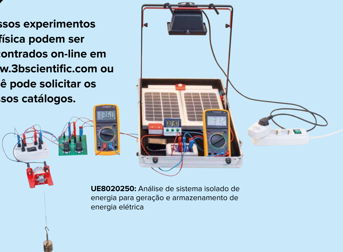
UE8020250: Análise de sistema isolado de energia para geração e armazenamento de energia elétrica

Nossos experimentos de física podem ser encontrados on-line em www.3bscientific.com ou você pode solicitar os nossos catálogos.