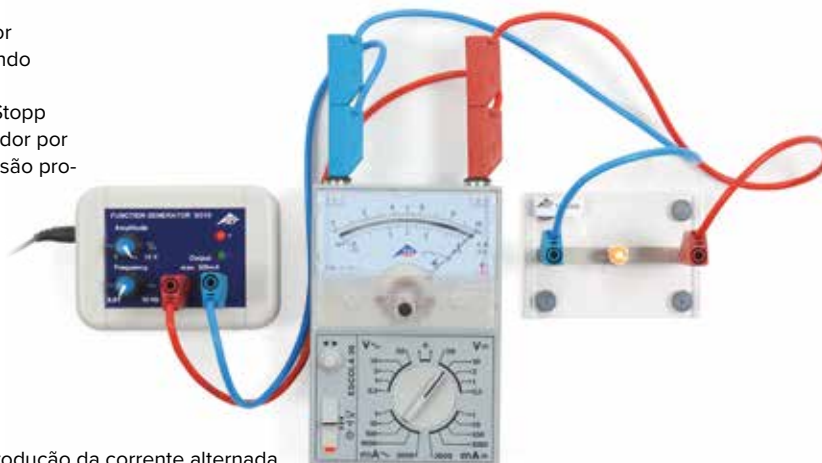
Experiência para introdução da corrente alternada